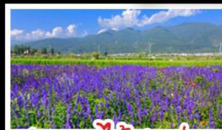
สวนดอกไม้ฮาวามู่ฉาง