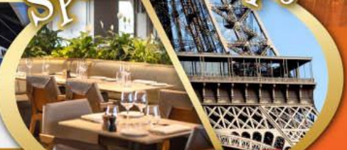
รับประทานอาหารกลางวัน บนหอไอเฟล

ไฮไลท์ในโปรแกรม • สะพานไมชาเปเล ลูเซิร์น