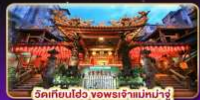
วัดเทียนเฮว จอพระเจ้าแม่มาจู่