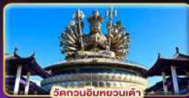
วัดกวนอิมทงเวินเต่า