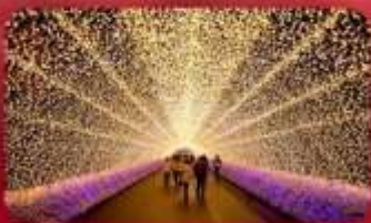
นาบานาโนะซาโตะ