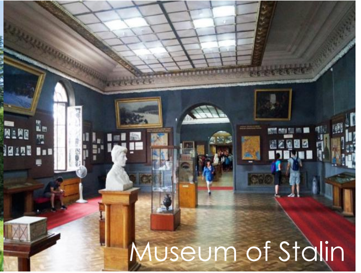
Museum of Stalin

กลางวัน รับประทานอาหารกลางวัน ณ ภัตตาคาร (8)