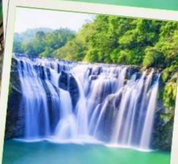
น้ำตกสีโอเฟิน