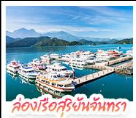
ล่องเรือสุริยจันทร์