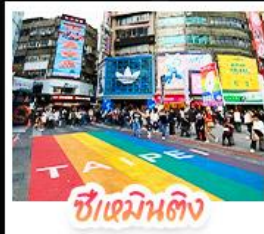
ซีเหมินต้ง