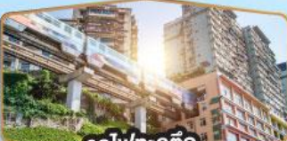
รถไฟฟ้า-สุตึก