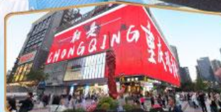
ถนนคนเดินถวณอันเฉียว