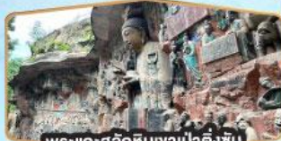
พระแกะสลักหินงาป่าตึงซัน