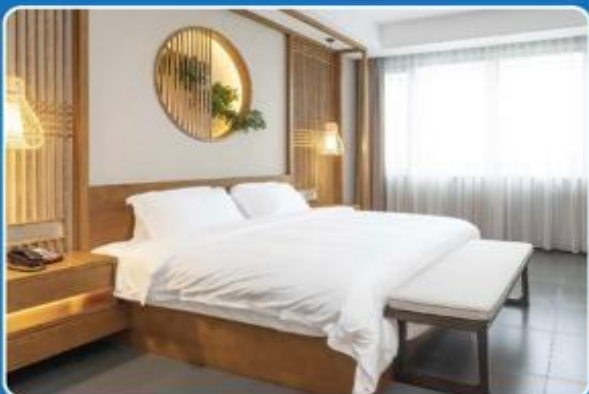
2 PERSON DOUBLE (DBL)