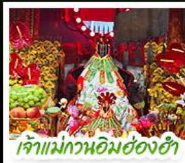
เจ้าแม่ทวนอิมฮ่องฮ่า