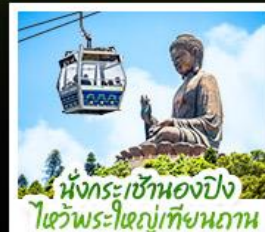
เน็กระเซาเองปิง โตะพระใหญ่เทียนทาน