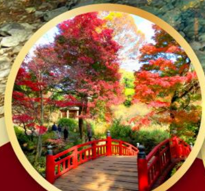
สวนดอกบ๊วยอาคาบิ