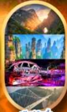
ฟรีคีย์เลือกซื้อ Option เสริม