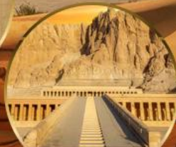
หุบเขากษัตริย์