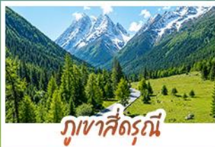
ภูเขาสัตว์ณี