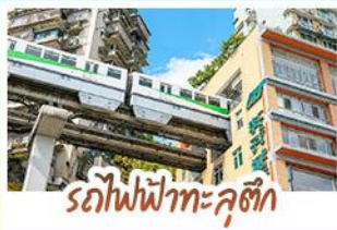
รถไฟฟ้าทะเลสาบสีจ้อป้า

ชมธรรมชาติ ณ อุโมงค์ ชมหุบเขาสุดอลังการระดับมรดกโลก นั่งรถไฟฟ้าทะเลสาบสีจ้อป้า สัญลักษณ์เมืองฉงชิ่งสุดล้ำ สัมผัสวิถีภูเขาหิมะแห่ง ภูเขาสัตว์ณี งดงามจนได้รับฉายา "เทือกเขาแอลป์แห่งตะวันออก" ชมธรรมชาติสุดฟิน ณ อุทยานปีฝั่งท้าว • ซ้อปิ้งจู่ใจ ถนนคนเดินไท่กู่หลี่, ถนนคนเดินซุนซู่