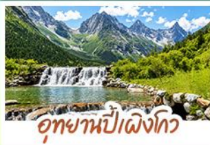
อุทยานปีฝั่งท้าว