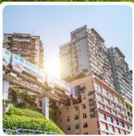
รถไฟกะลุดัก