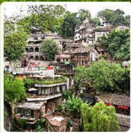
ตรอกโบราณเซี่ยฮ่าวหลี่