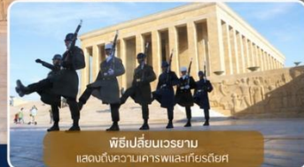
พิธีเปลี่ยนเวรยาม แสดงถึงความเคารพและเกียรติยศ