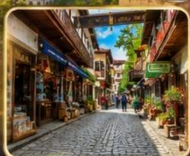
เดินเล่นย่านเมืองเก่าบรรยากาศย้อนยุค