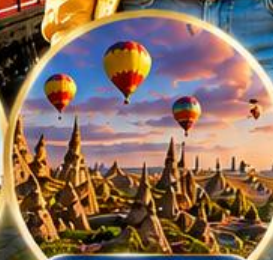
เมืองคปปาโดเกีย Cappadocia