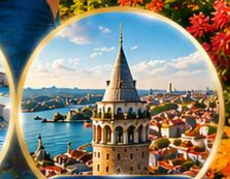
หอคอยกาลาตา Galata Tower