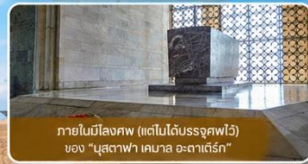
ภายในมีสิ่งศพ (แต่ไม่ได้นำบรรจุศพไว้) ของ "มุสตาฟา เคมาล อะตาเติร์ก"