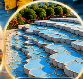
ปามุกคาล์ Pamukkale