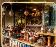
เลือกซื้อของฝากงานหัตถกรรมพื้นเมือง