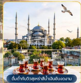
ต้นตากับวิวกาโบราสีน้ำเงินอันงดงาม

พิเศษ...สุดๆ! นำท่าน ขึ้นสู่จุดเช็คอินแห่งใหม่ Seven Hills Café ซึ่งเป็นสถานที่ยอดนิยมขณะนี้...บนชั้นดาดฟ้า ของโรงแรมเซเวนฮิลล์ส ท่านจะได้ถ่ายรูปกับวิวมุมต่าง ๆ ช่องแคบบอสฟอรัส, สุเหร่าสีน้ำเงินและสุเหร่าฮาเกียโซเฟีย พร้อม ให้อาหาร กับเหล่าพนักงานนวลที่จะบินมารับอาหารจากท่าน **ขออนุญาตท่านที่ชื่นชมความงามวิวกาโบราช่วยอุดหนุนเครื่องดื่ม ชา กาแฟ ซอฟดริงค์ อื่นๆ ตามต้องการ