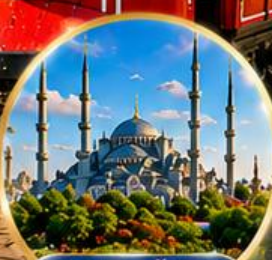
สุเหร่าสีน้ำเงิน Blue Mosque