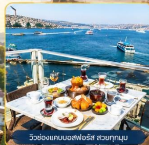
วิวช่องแคบบอสฟอรัส สวยทุกมุม