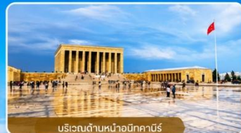
บริเวณด้านหน้าอนีกาบิร์