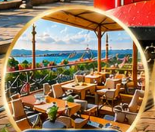
Seven Hills Cafe ชมวิว อิสตันบูล