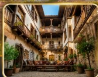
บ้านเรือนสไตล์ออตโตมัน อายุกว่า 200 ปี

เมืองท่องเที่ยวที่มีชื่อเสียงของจังหวัดการาบิก (Karabük) ในปี 1994 เมืองซาฟรานโบลู ได้ถูกองค์การยูเนสโกยกให้เป็นมรดกโลกทางด้านวัฒนธรรม