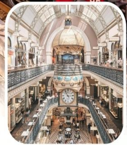
QUEEN VICTORIA BUILDING