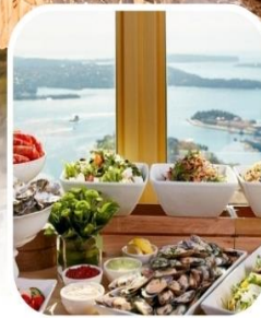
SKYFEAST BUFFET SYDNEY TOWER