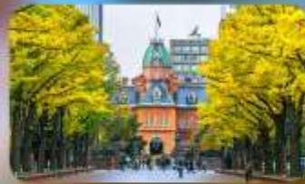
อัสระตามอัสระสาย 1 วัน