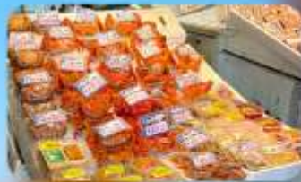
ตลาดปลาโจโก