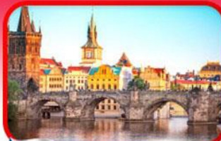
เขื่อนอินสะพานชาร์ลส์