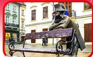
ย่านเมืองเก่าปราทิสลาวา

เที่ยวเมืองสวยริมทะเลสาบ ฮัลล์สตัดท์ • ชมเมืองไข่มุกแห่งโบฮีเมีย เซสกี กรุงลอน • ปราท • เวียนนา • ซอปปิงพาร์นดอร์ฟ เอาก์เล็ท