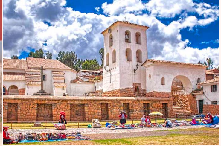
เที่ยง บริการอาหารกลางวัน ณ ภัตตาคาร Hanka Restaurant