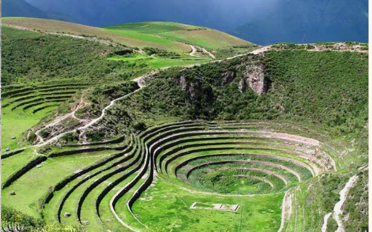
บ่าย นำท่านเดินทางสู่ มาราซ (Maras) แหล่งผลิตเกลือที่คุณภาพดีที่สุดในโลก ที่มีมาตั้งแต่สมัยอินคา แวนาซันบันไดที่เรียงอยู่ตามลำดับความสูงของภูเขา จากนั้นเดินทางสู่ โมเรย์ (Moray) นาขั้นบันไดวงกลมขนาดใหญ่หลายๆรูปร่างแปลกตาที่ชาวอินคาทำไว้เพื่อทดลองปลูกพืชพันธุ์ต่างๆ จากจุดนี้สามารถมองเห็น หมู่บ้านอูรัมบัмба (Urubamba) ได้อีกด้วย ได้เวลาเดินทางกลับสู่เมือง เมืองคัสโก (Cusco) เมืองหลวงของอาณาจักรอินคา ที่แพร่ขยายอำนาจจนกินพื้นที่ 1 ใน 3 ของอเมริกาใต้ ตั้งอยู่เหนือระดับน้ำทะเลถึง 3,400 เมตร และเป็นแหล่งอารยธรรมยุคก่อนประวัติศาสตร์ที่ลึกลับน่าทึ่ง เป็นชุมชนเก่าแก่ของจักรวรรดิอินคาอันรุ่งเรือง ซึ่งยังคงทิ้งร่องรอยความเจริญไว้ให้เห็นเป็นซากปรักหักพังโบราณและโบราณวัตถุต่างๆ