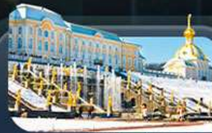
พระราชวังปีเตอร์ฮอฟ