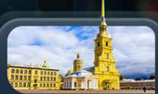
ป้อมปีเตอร์แอนด์ปอล

ไฮไลท์ สองเมืองไฮไลต์ของรัสเซียที่ไม่ควรพลาด! ตื่นตาตื่นใจกับมหาวิหารเซนต์บาซิล ชมความยิ่งใหญ่ของจัตุรัสแดง สัมผัสอดีตที่พระราชวังเครมลิน ชมความงามของสถานีรถไฟใต้ดินมอสโก ชาร์กอร์ส โบสถ์ไอสิกรีนดี เป็นเขาสเปร์โรว์ให้คุณได้สัมผัส ชมความงามพระราชวังฤดูหนาว พิพิธภัณฑ์ฮอร์มิงทง ป้อมปีเตอร์แอนด์ปอล และมหาวิหารเซนต์ไอแซค