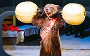
ชมละครสัตว์