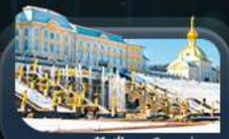
พระราชวังปีเตอร์ฮอฟ