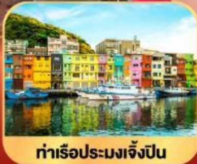
ท่าเรือประมงเจิ้งปิ่น