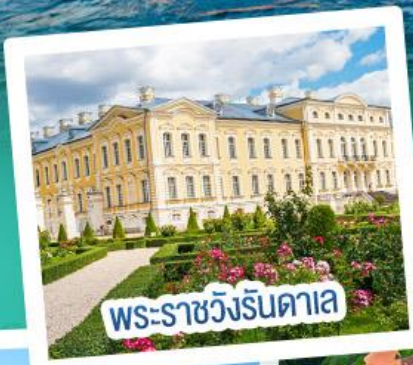
พระราชวังรินดาเล