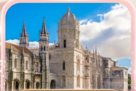
มหาวิหารเจโรนิโม