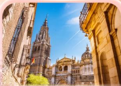
มหาวิหารแห่งโกเอลดา

ซาคราเดา ที่ว่ายิ่งใหญ่ ยังไม่ทำใจ... ที่ให้เธอไปหมดแล้ว