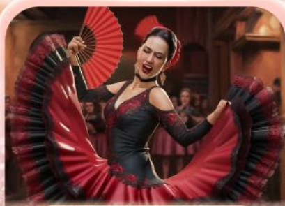
ระบำฟลามิงโก